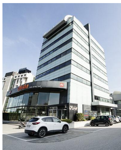
Sede italiana: BICENTER - Padova

Etex Italia è un'azienda commerciale parte di Etex Group , multinazionale nel settore rivestimenti in fibrocemento ecologico per facciate ventilate . Nata come filiale italiana del grande gruppo internazionale nel 2014, l'azienda ha sede a Padova e nella sua offerta può contare su una gamma di materiali di assoluta qualità realizzati da stabilimenti in Belgio e Germania con oltre 100 anni di produzione alle spalle.